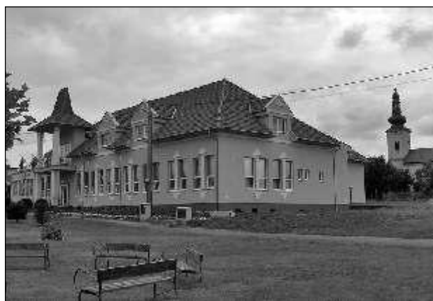
Vámosladány - a kultúrház és a templom